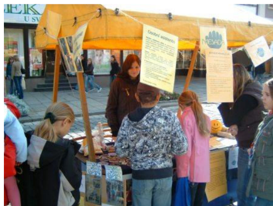
Evropský týden mobility