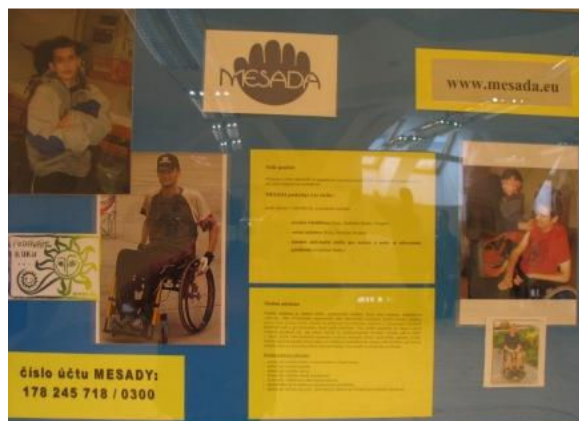
Prezentace MESADY ve Sladovně v Písku