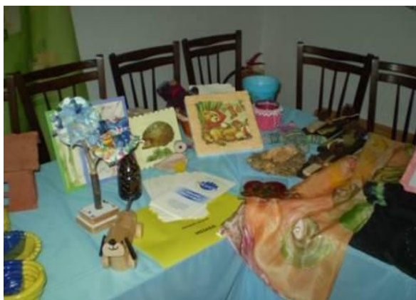
Výstava výrobků v Centru pro zdravotně postižené v Písku